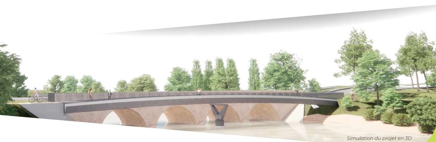
Simulation du projet en 3D