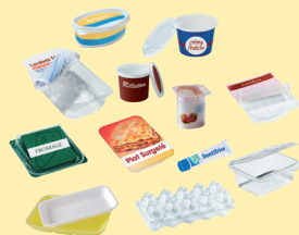
Pots, boîtes et barquettes en plastique