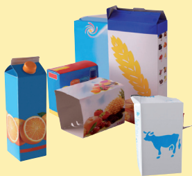
Emballages en carton