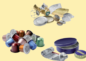
Petits emballages métalliques