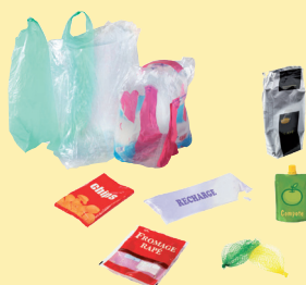
Sacs, sachets et films en plastique