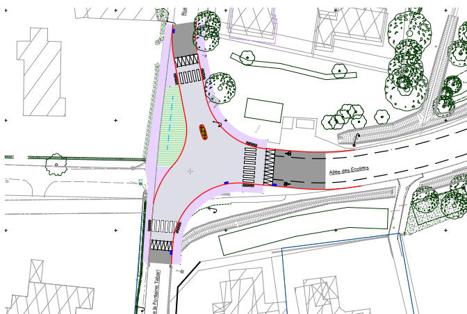
Réaménagement du carrefour de l'allée des écoliers avec la rue centrale et la RD86

Il restera les plantations à effectuer dans quelques semaines sur tous ces nouveaux aménagements. La signalétique dans les rues du bourg sera également revue.