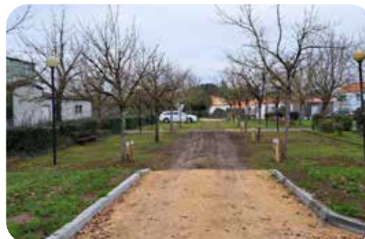
Parking de la salle des sports, rue des Hirondelles