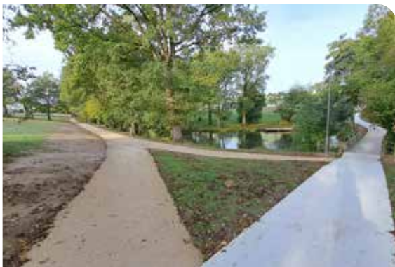
Liaisons douces autour de l'étang de la Doline