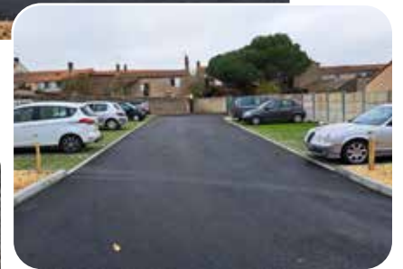
Parking des jardins de la Doline