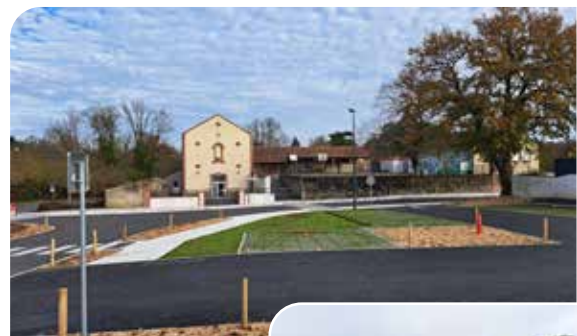
Carrefour de l'école