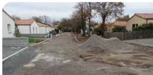
Le chemin du Verger

En parallèle, les travaux d'élargissement de la rue des hirondelles reprendront. Le carrefour du cimetière sera réaménagé ainsi que le carrefour de l'allée des écoliers avec la rue centrale et la RD86 (route en direction de Treize Septiers).