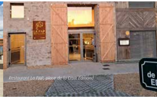
Restaurant La PAP, place de la Croix Edmond