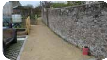
Venelle au travers des jardins de la Doline (vers le carrefour du café)